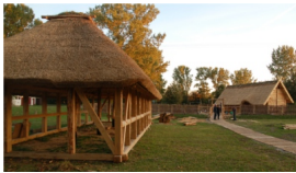
Zagroda w trakcie prac końcowych

Jak dotąd nie natrafiono na większą ilość śladów osadnictwa kultury przeworskiej w regionie hrubieszowskim, co potwierdza, epizodyczny, przejściowy charakter obecności Wandalów na tych ziemiach. Ta część, której udało się uniknąć krwawej konfrontacji z Gotami, jak np. plemiona wandalskich Hasdingów i Wiktofalów, osiedliła się w granicach Imperium Rzymskiego, licząc choćby na udział i łupy zdobyte w trakcie „wojen markomańskich”.